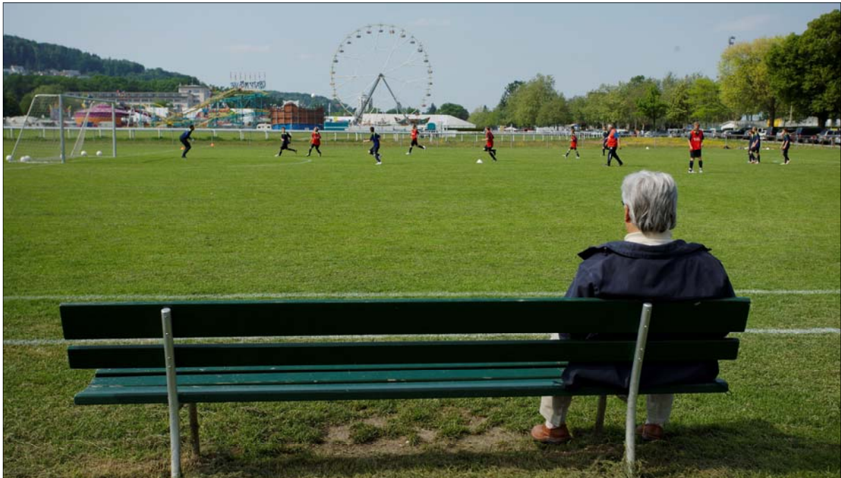
Die Luzerner Allmend, das grösste Sport-, Freizeit- und Messengelände der Zentralschweiz.

Für die Erneuerung der Infrastruktur der Messe Luzern werden rund 55 Millionen Franken investiert. Die Stadt leistet einen Beitrag von 18,5 Millionen Franken, der Kanton Luzern will weitere 7 Millionen Franken beisteuern. Der Rest wird von der Luzerner Messe- und Ausstellungsgenossenschaft (Lumag) finan-