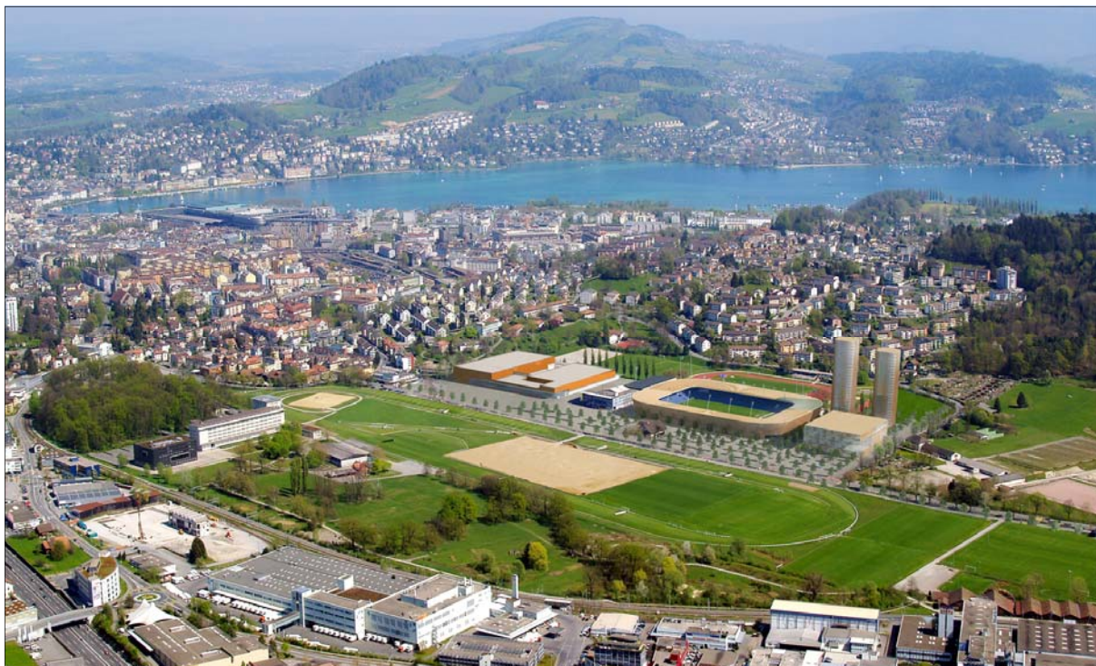
Die neue Sportarena mit dem Fussballstadion, dem Sportgebäude und den beiden Wohn-Hochhäusern. Links davon die neuen Messehallen.