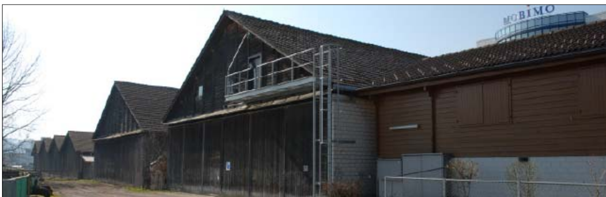
Die alten Fliegerschuppen auf der Allmend.

Im Rahmen des Land- und Rechtserwerbes ist der Abtretungs- und Baurechtsvertrag für das neue Trasse unterzeichnet. Entwürfe für Verträge bzw. Vereinbarungen liegen zu den Themen Zusammenarbeit Partner, Bauwerksvertrag (Übergabe Bauwerk an die zb), Fliegerschuppen, Installationsplätze und Deponien und Altlastensanierung vor.